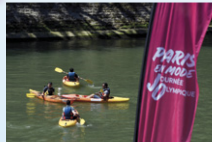
Paris 2024 au cœur de la Journée olympique 2018

www.cnds.sports.gouv.fr > Héritage et société